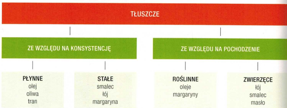
Ryc. 71. Podział tłuszczów jadalnych

Tłuszcze spożywcze, nazywane również jadalnymi, to produkty pochodzenia roślinnego lub zwierzęcego, składające się z substancji tłuszczowej przeznaczonej do spożycia.