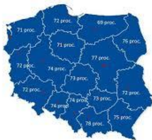
Wykres 1. Zdawalność egzaminu maturalnego wśród tegorocznych maturzystów w województwach

Powyższe dane zawierają zarówno wyniki uzyskiwane przez uczniów szkół publicznych, jak i niepublicznych. Ze względu na fakt występowania wśród szkół niepublicznych dużego odsetku szkół dla dorosłych, które statystycznie uzyskują niższe wyniki, województwa, w których występuje wysoka liczba ww. szkół, uzyskują słabsze wyniki. Niestety ze względu na przesunięcie czasowe egzaminu maturalnego w bieżącym roku opóźnione będzie też szczegółowe sprawozdanie o wynikach egzaminu maturalnego, które zostanie opublikowane dopiero w dniu 30 października 2020 r., stąd też opublikowane dane statystyczne w niniejszym opracowaniu mają jedynie charakter podstawowych informacji.